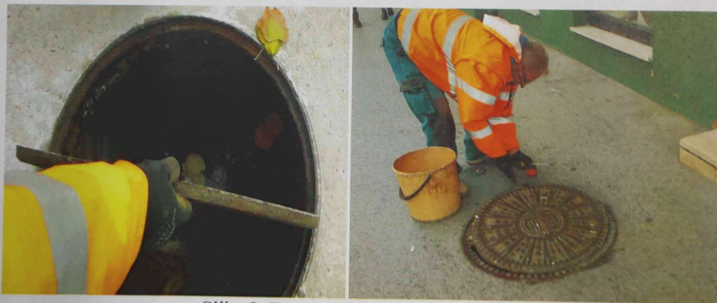
Slika 2. Tretmani kanalizacione mreže

U periodu od 01.-13.10.2020. godine, Ciklonizacija AD sprovela je tretmane deratizacije kanalizacione mreže na teritoriji grada Zrenjanina. Tretirani su kanalizacioni šahtovi biocidnim preparatom otpornim na vlažnu sredinu, Mamak „B“(KH)BB-parafinski mamak, Slika 2..