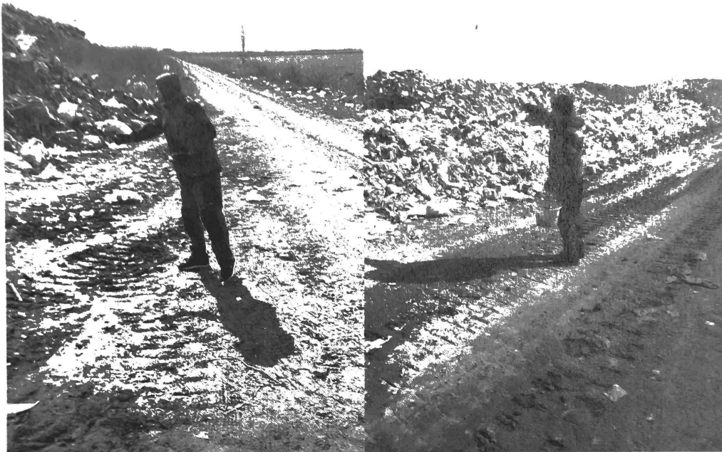
Slika 3. Deratizacija deponija

Na pijacama je vršena deratizacija šaftova, kao i otvora i pukotina.