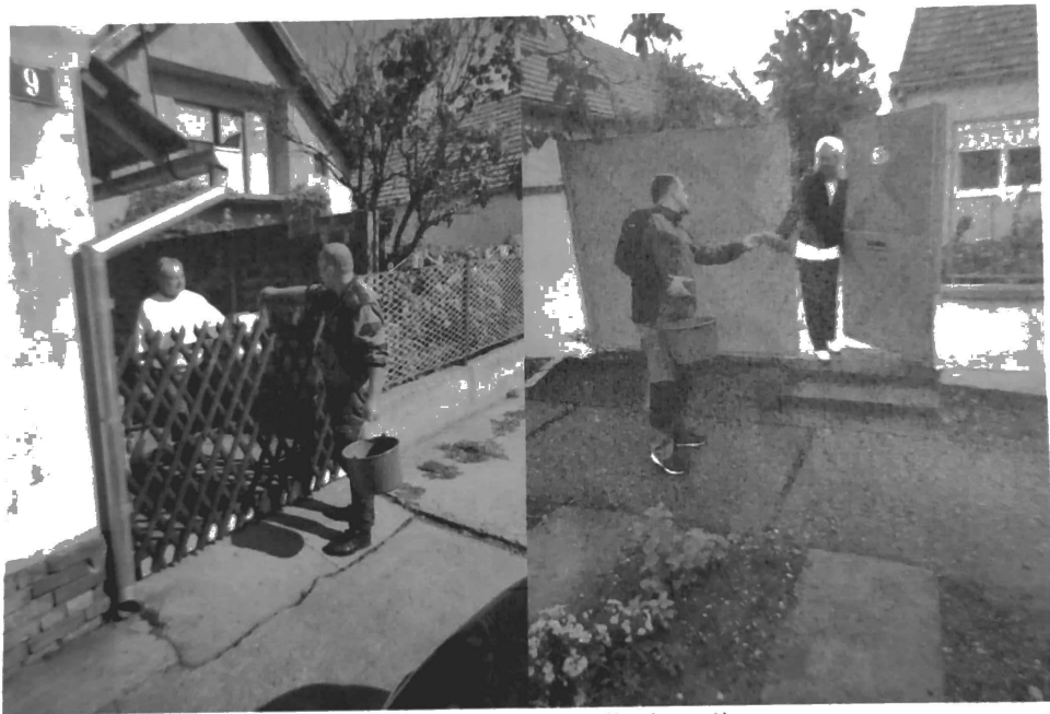
Slika 1. Sistematska deratizacija domaćinstava

U periodu od 01. – 31.10.2020. godine, operativci Ciklonizacije A.d izvršili su sistematsku deratizaciju domaćinstava, rasutim mamkom (Mamak „B“(KH)-RB) namenjenim za tretmane u zatvorenim sredinama. Operativci Ciklonizacije A.d uz odobrenje stanovništva postavljali su mamak na privatnim posedima ili predavali stanovništvu u skladu sa tehničkom specifikacijom ugovora, Slika 1. Biocidni mamci postavljeni su na bezbedne pozicije kako ne bi došli u kontakt sa decom i domaćim životinjama.