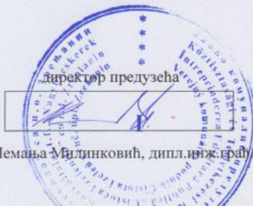
Немања Милинковић, дипл.инж.град