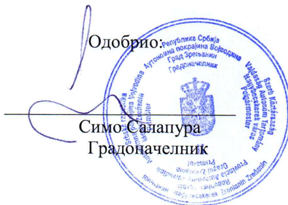
Симо Салапура Градоначелник