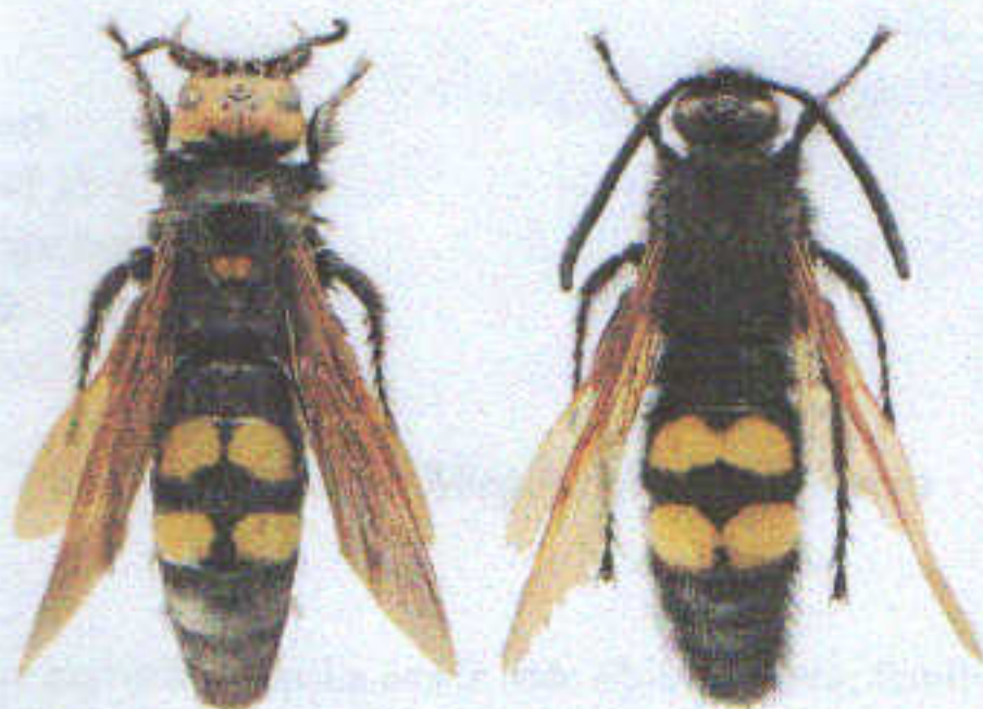
Slika 1. Mamutská osa ( Megascolia maculata )

Iako liče na stršljena i ljudi ih često mešaju, u pitanju je krupna vrsta koja je veoma korisna i nije agresivna ni opasna za ljude . Nalaze se uvek u blizini trulih panjeva, a njihova veća brojnost ukazuje na prenamnožavanje neke vrste tvrdokrilaca (najčešće majskog gundelja). Ženke mamutške paralizuju larvu tvrdokrilca i polažu jaja u nju, a kada se izlegu, larve mamutške ose parazitiraju na larvama tvrdokrilaca i samim tim smanjuju brojnost nekih štetnih insekata. Kada pojedu larvu tvrdokrilca, prelaze u stadijum lutke iz koje se sledećeg proleća razvijaju odrasle jединke. Odrasle jединke se hrane nektarom, pa imaju značajnu ulogu kao oprašivači.