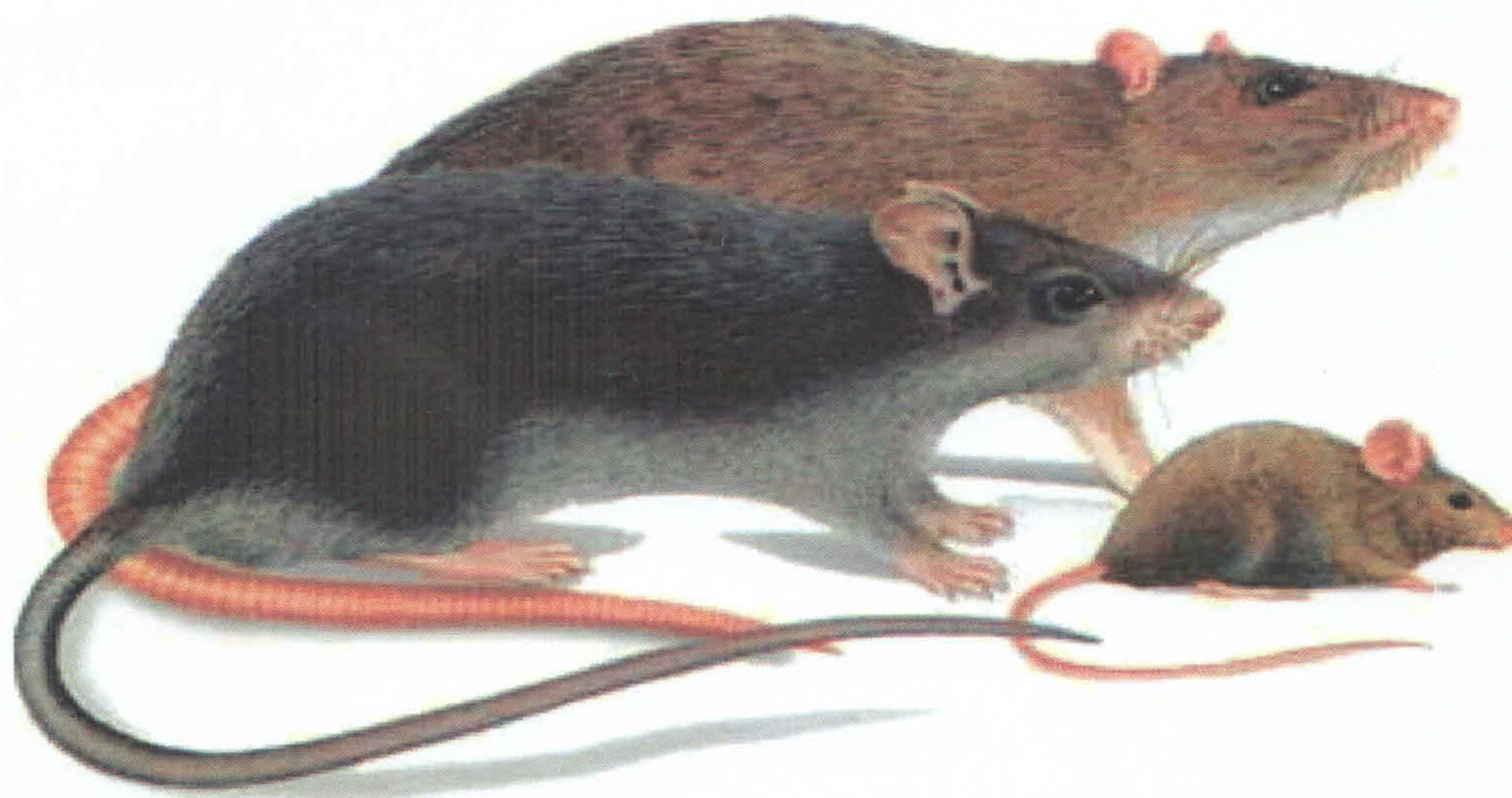
Slika 1. Najčešće prisutni glodari čovekove okoline

Samo u proteklih nekoliko godina zabeleženi su slučajevi da su pojedini kvartovi ostajali bez struje ili su semafori bili van funkcije zbog oštećenja prouzrokovanih pregrizanjem vodova od strane pacova. Zbog sekutića koji stalno rastu i stalno se moraju trošiti na tvrdim materijalima pacovi posežu za predmetima koji im nisu jestivi niti su im prepreka, već na njima jednostavno zadovoljavaju prirodnu potrebu za glodanjem, Slika 1.