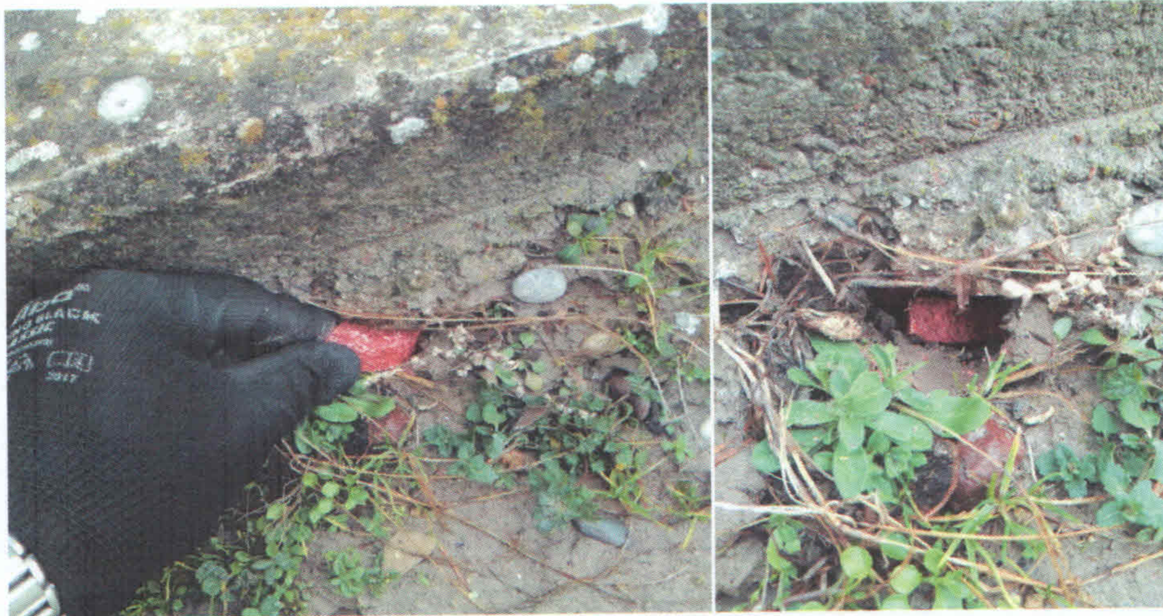
Slika 7. Deratizacija groblja

Ciklonizacija A.d je 22.11.2018. godine počela deratizaciju groblja na teritoriji grada Zrenjanina. Na grobljima i pijacama je postavljan parafinski mamak Mamak „B“ (KH) BB, namenjen za tretmane u vlažnim i otvorenim sredinama. Tretirani su otvori u travnjacima oko grobnih mesta, otvori, ruše i pukotine oko grobnih mesta nastali usled aktivnosti glodara. Mamak je potom zatrpan u cilju bezbednosti po stanovništvo i domaće životinje, Slika 7.