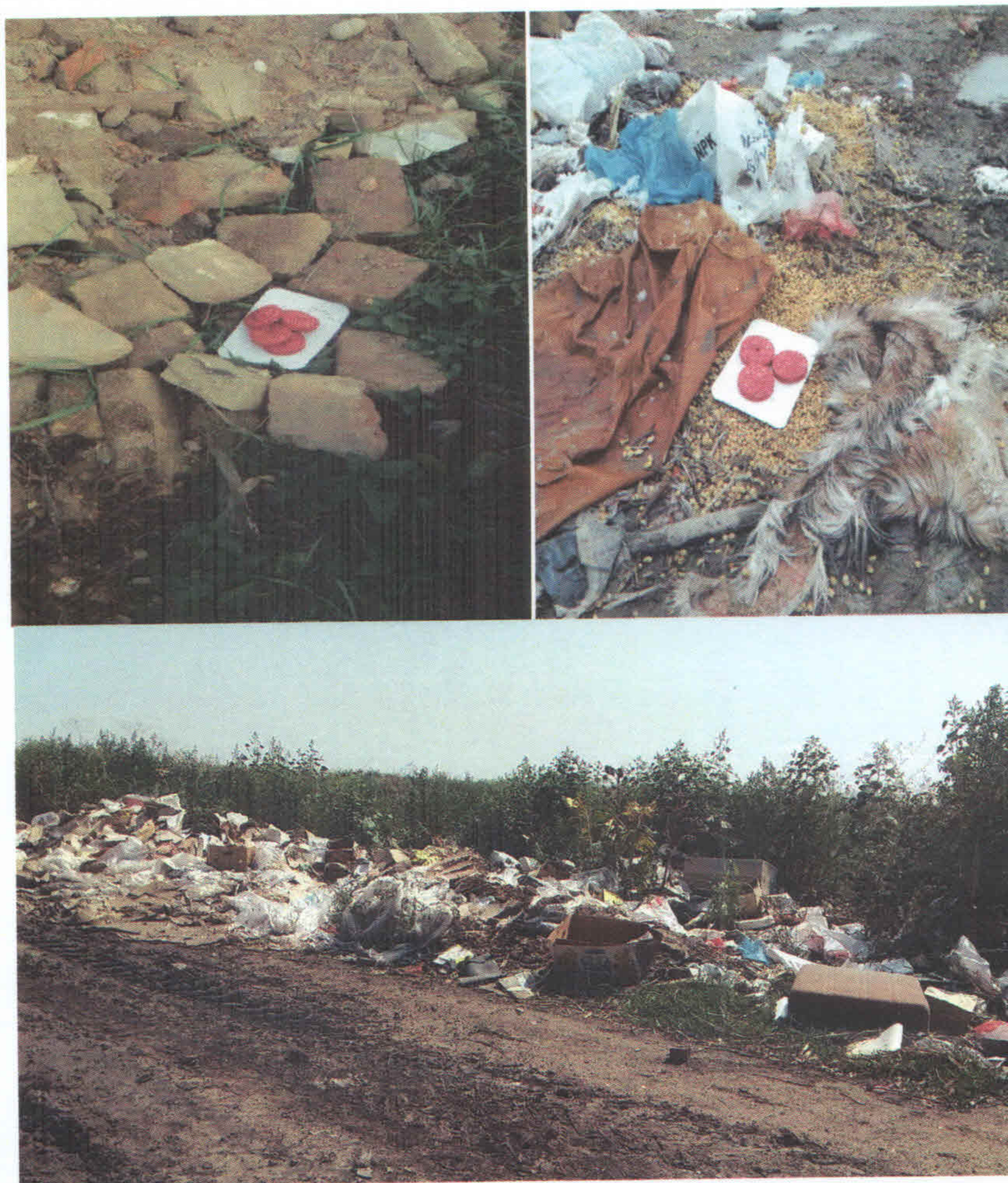
Slika 5. Deratizacija deponija smeća