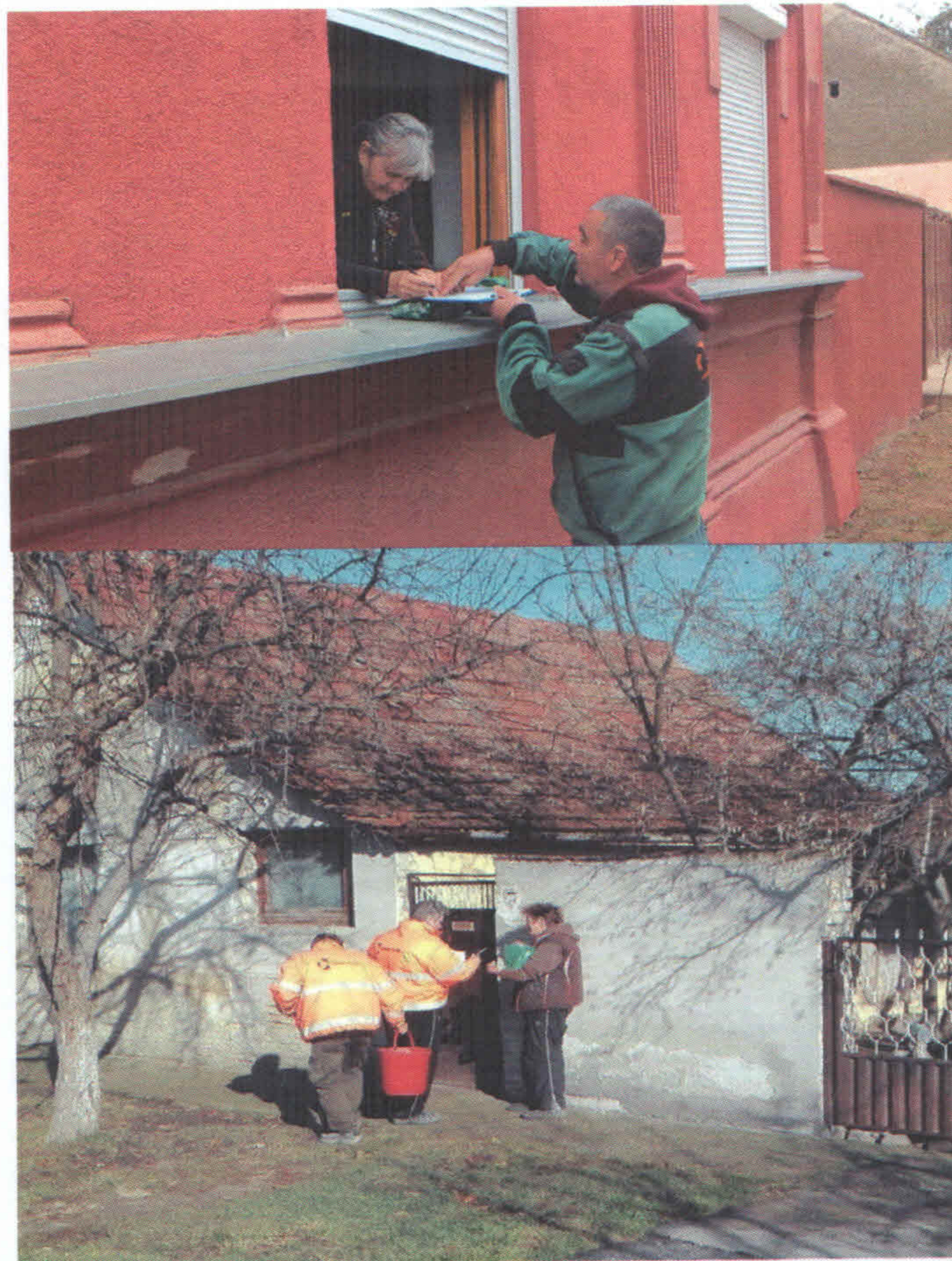
Slika 2. Sistematska deratizacija domaćinstava

Sistematska deratizacija individualnih domaćinstava je vršena rasutim mamkom (Mamak„B“(KH)-RB) namenjenim za tretmane u zatvorenim sredinama. Operativci Ciklonizacije A.d uz odobrenje stanovništva postavljali su mamak na privatnim posedima ili predavali stanovništvu u skladu sa tehničkom specifikacijom ugovora, Slika 2. Biocidni mamci postavljeni su na bezbedne pozicije kako ne bi došli u kontakt sa decom i domaćim životinjama.