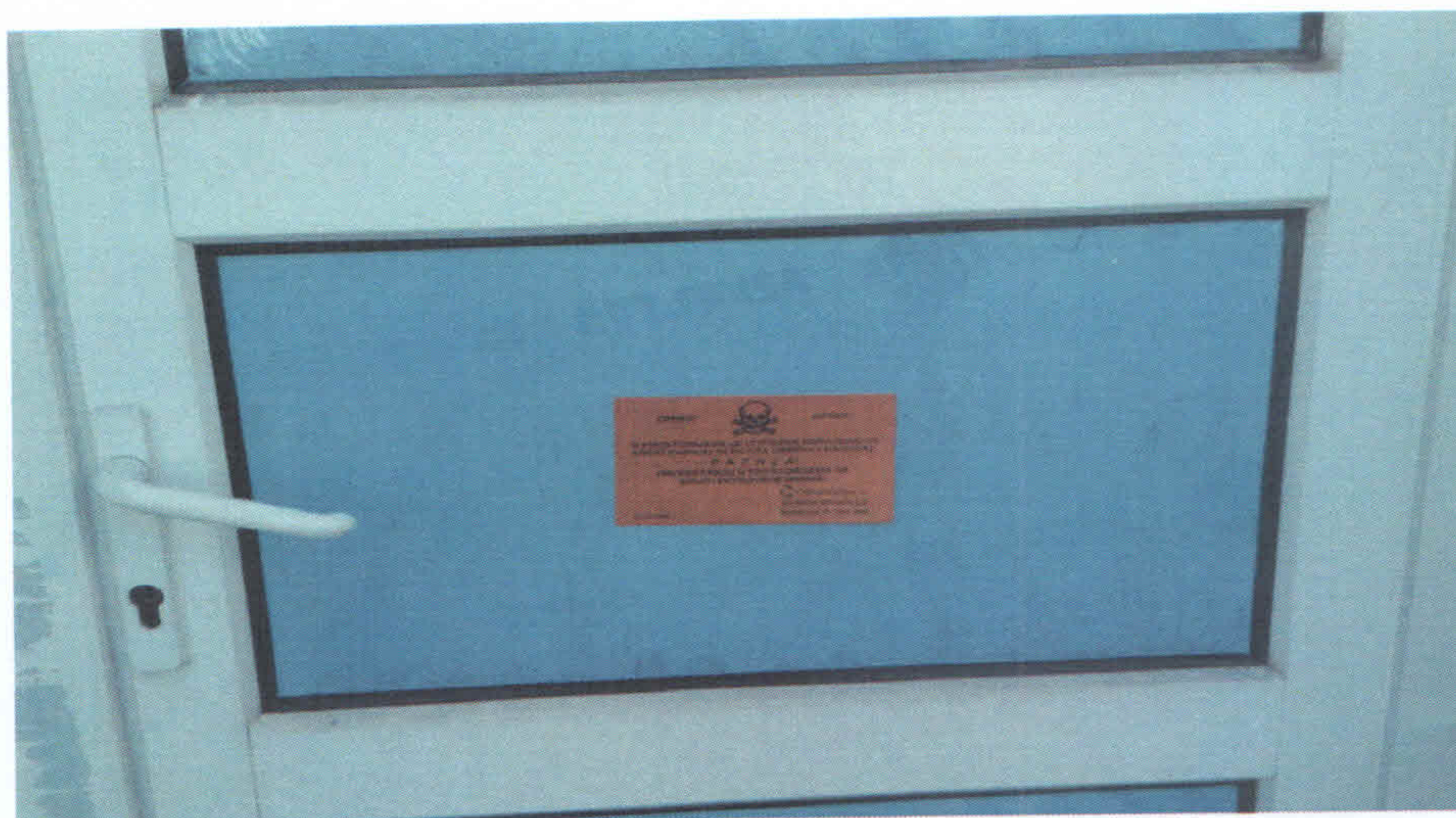
Slika 8. Deratizacija školskih i predškolskih ustanova

U skladu sa Ugovorom za javnu nabavku u otvorenom postupku usluge deratizacije, br. 404-3-23-35/2018-IV zaključenog dana 21.06.2018. godine, Ciklonizacija A.d je u periodu od 23.10. do 25.12.2018. godine sprovela je celokupan tretman sistematske deratizacije na teritoriji grada Zrenjanina, Tabela 1. Usluga je izvršena u ugovorom predviđenom vremenskom roku, stručno i kvalitetno primenom najsavremenijih i najkvalitetnijih sredstava i opreme iz oblasti DDD-a. Tretmanima nije ugroženo zdravlje stanovništva niti je narušena radna i životna sredina.