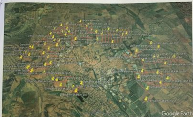
Slika 2. Zrenjanin- atarski putevi tretman ambrozije-mašinskim košenjem