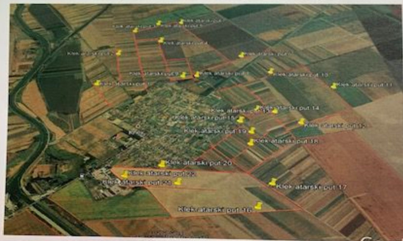
Slika 3. Klek- atarski putevi tretman ambrozije-mašinskim košenjem