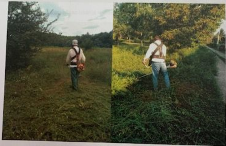
Slika 1. Mehaničko suzbijanje ambrozije ručnim košenjem

Na osnovu preporuke broj 10, košene su javne površine u naselju uz kanale, bare, deponije, saobraćajnice, zelene površine na kojima je predhodnim monitoringom utvrđeno prisustvo ambrozije Slika 1. i Slika 2.