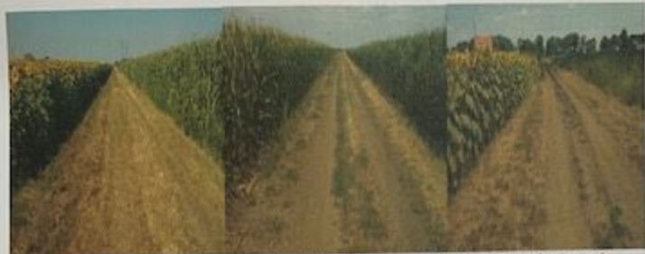
Slika 4. Izgled lokacija posle mehaničkog tretmana ambrozije-mašinskim košenje

Mehaničko suzbijanje ambrozije postupkom mašinskog košenja na osnovu ugovora broj 404-3-5-13/2020-IV Ciklonizacija A.D. sprovela je na površini od 651.892 m 2 na teritoriji grada Zrenjanina.