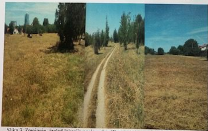
Slika 3. Zrenjanin- izgled lokacija posle mehaničkog tretmana ambrozije-ručnim košenjem