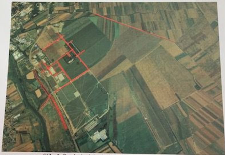
Slika 3. Zrenjanin- lokacije hemijskog tretmana ambrozije