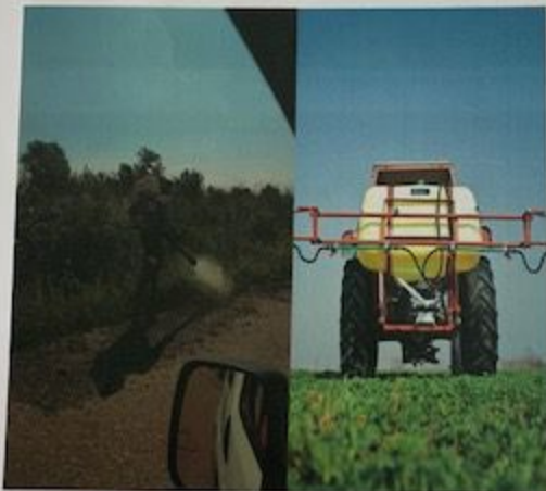
Slika 1. Tretman suzbijanja ambrozije

Na osnovu preporuke broj 1, tretirane su javne površine uz naselja, deponije, saobraćajnice, zelene površine na kojima je prethodnim monitoringom utvrđeno prisustvo ambrozije. Tretman suzbijanja ambrozije sproveden je pomoću atomizera sa traktorima i ručnim motornim atomizerima. Hemijski tretman suzbijanja ambrozije odrađen je preparatom totalnim herbicidom Bingo 480 SL, Slika 1.