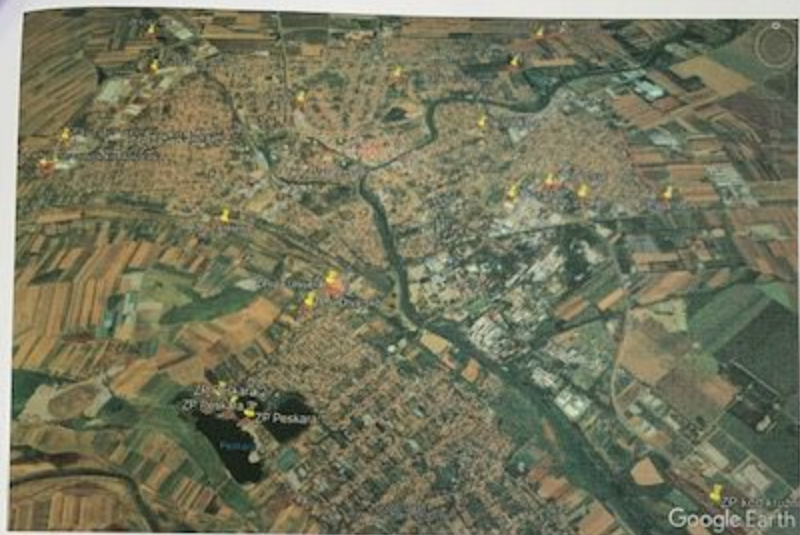
Slika 2. Zrenjanin- prikaz lokacija mehaničkog tretmana ambrozije-ručnim košenjem