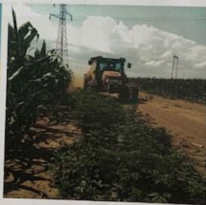
Slika 1. Mehaničko suzbijanje ambrozije mašinskim košenjem