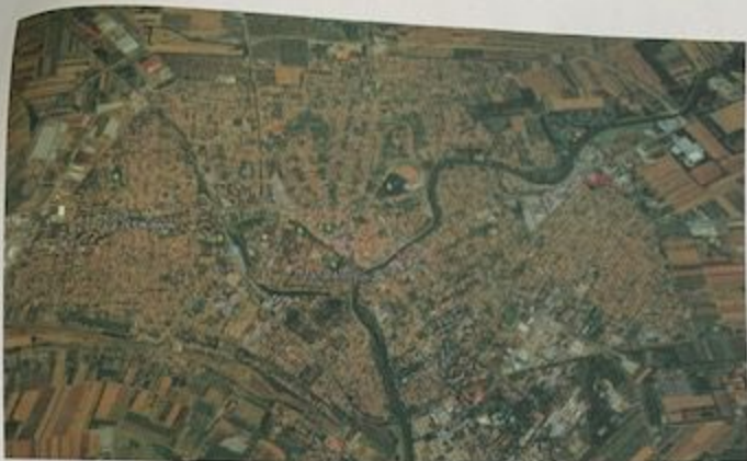
Slika 4. Zrenjanin- lokacije hemijskog tretmana ambrozije

Na osnovu ugovora broj 404-3-5-13/2020-IV Ciklonizacija AD sprovela je hemijski tretman ambrozije na ukupnoj površini od 300,000 m 2 . U narednom period Ciklonizacija AD pratiće razvoj ambrozije. Redovnim monitoringom, daljinskom detekcijom imaćemo realan uvid u stanje na terenu teritorije grada Zrenjanina, na osnovu kojih ćemo sprovesti naredne tretmane suzbijanja ove alergijske biljke u cilju zaštite stanovništva i poboljšanja kvaliteta života građana.