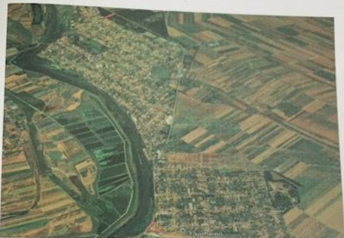
Slika 2. Stajičevo i Ečka- lokacije hemijskog tretmana ambrozije