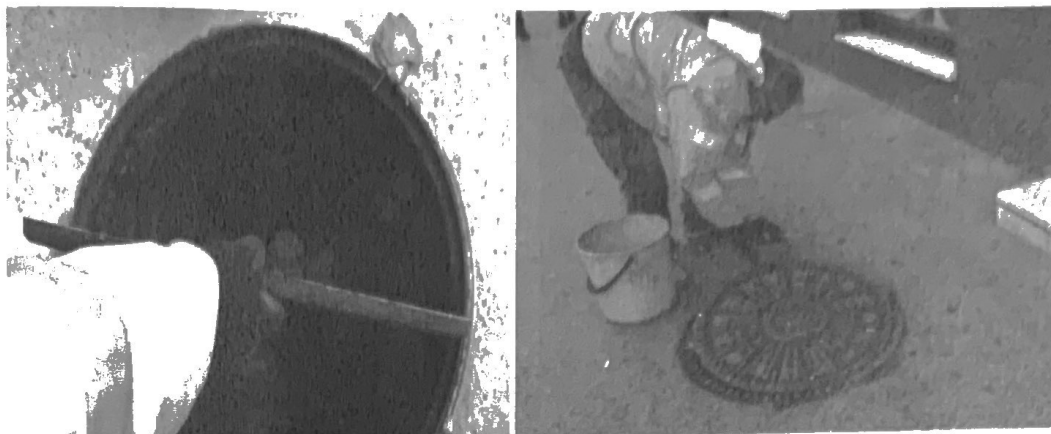
Slika 2. Tretmani kanalizacione mreže

Na teritoriji grada Zrenjanina, u periodu od 18.-30.09.2020. tretirano je ukupno 1.783 kanalizacionih šahtova.