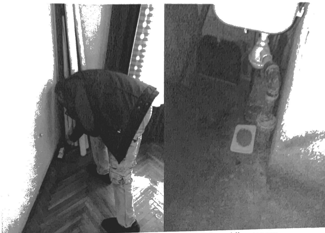
Slika 4. Deratizacija školskih, predškolskih i verskih ustanova

U skladu sa tehničkom specifikacijom deratizacija: