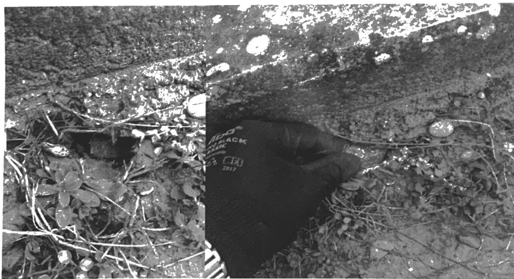
Slika 3. Deratizacija grobalja i pijaca

Na grobljima i pijacama je postavljan parafinski mamak Mamak „B“ (KH) BB, namenjen za tretmane u vlažnim i otvorenim sredinama. Tretirani su otvori u travnjacima oko grobnih mesta, otvori, ruše i pukotine oko grobnih mesta i objekata nastali usled aktivnosti glodara. Na pijacama je vršena deratizacija šahtova, kao i otvora i pukotina. Mamak je potom zatrpavan u cilju bezbednosti po stanovništvo i domaće životinje, Slika 3.