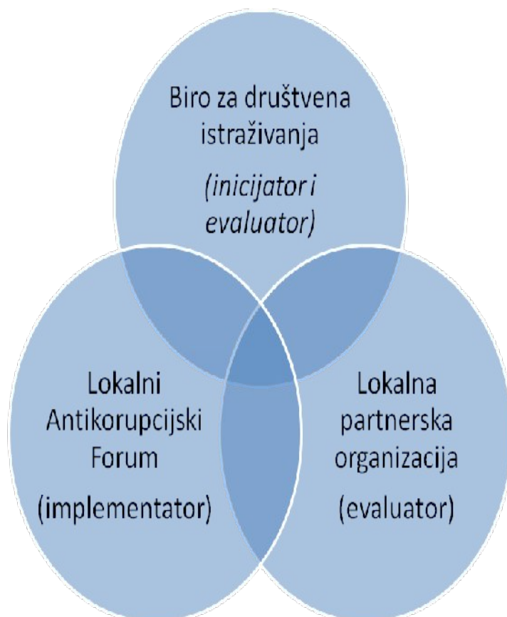
Shema 1. Akteri u procesu kreiranja, realizacije, monitoringa i evaluacije Lokalnog plana za borbu protiv korupcije