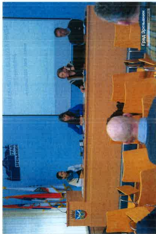
Прилог 2. фотографије са одржане јавне расправе